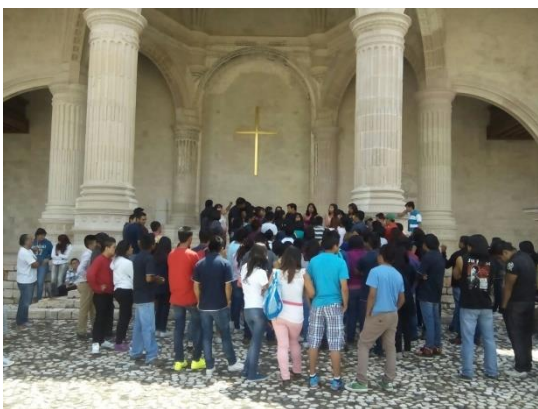
Fig.3. Viajes de estudio. (Ruta Dominicana)

Otro elemento a considerar para la elaboración y difusión de la tutoría entre la comunidad escolar es la filosofía institucional que acompaña al PAT, elaborada fundamentalmente a partir de dos rubros: Misión y Visión, en