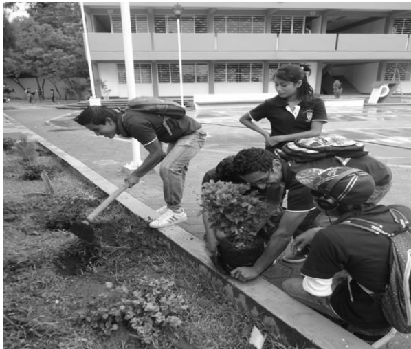
.Fig. 2. Integración del alumnado a la institución.

Se realizan estrategias para promover el PAT, tales como: