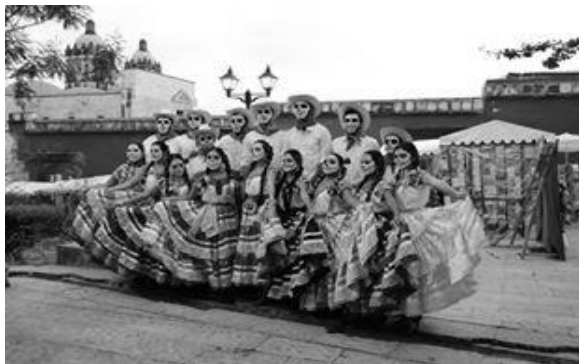
Fig. 4. Grupo folclórico, actividades paraescolares.

Si bien los resultados que se muestran son alentadores, el Plan de Acción Tutorial en la Escuela Preparatoria No. 7 de la UABJO todavía requiere de un mejoramiento continuo en diferentes rubros. Dos aspectos requieren atención inmediata: