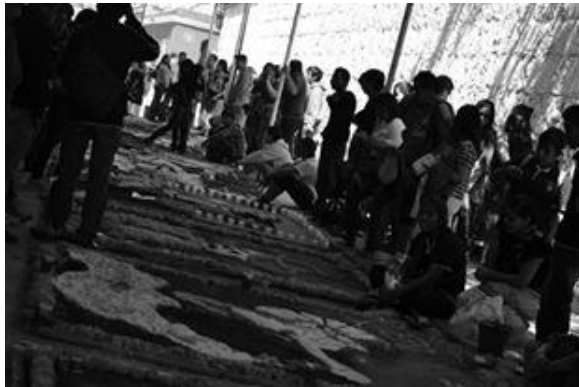
Fig. 5. Tapetes de muertos.

La información que se presenta es al mismo tiempo una muestra de las acciones de promoción y difusión del Programa Institucional de Tutorías y el resultado del Plan de Acción Tutorial, que se encuentra en una condición de mejora continua. Este trabajo tiene una relevancia especial porque contiene la información básica para identificar el Programa entre la comunidad escolar, así como incorpora una visión del contexto social y cultural propio de la Universidad oaxaqueña y sus actores primordiales. Dadas las condiciones de multietnicidad y multiculturalidad que se desenvuelven en nuestro estado, también resulta fundamental reflejar esta identidad de los sujetos educativos en las acciones de difusión y promoción del programa de tutorías.