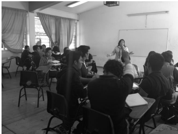
Fig. 1. Tutoría grupal.

De igual manera los estudiantes asumen compromisos en su desarrollo académico y que forman parte de las acciones tutoriales, como la participación en las actividades complementarias y la evaluación del trabajo tutorial. Con esto también se da cumplimiento al objetivo general del PAT implementado en la Preparatoria No. 7, que busca contribuir a mejorar el aprovechamiento escolar y promover la responsabilidad y autonomía de los estudiantes. Esto se logra, desde luego, con un conjunto de objetivos específicos que permiten al PAT vincular el proyecto institucional con las acciones cotidianas de estudiantes y tutores. Entre estos objetivos se puede mencionar: