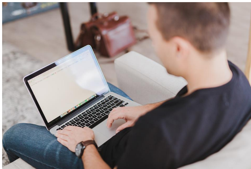
Imagen 1. Un formato de tareas predeterminado ayuda en el proceso de elaboración y entrega de las mismas.