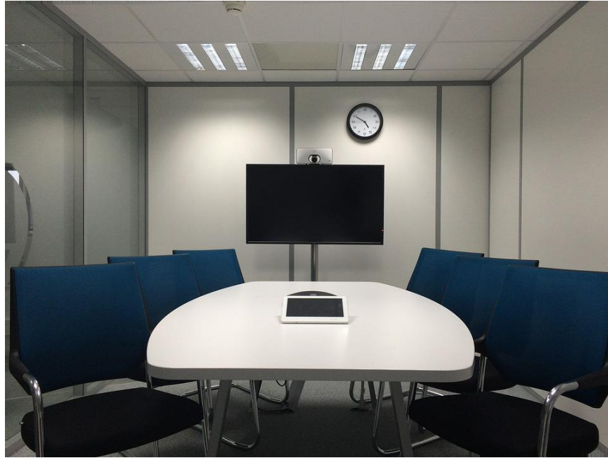
Imagen 1. Se recursos audiovisuales (cámaras, monitores de televisión, pantallas.