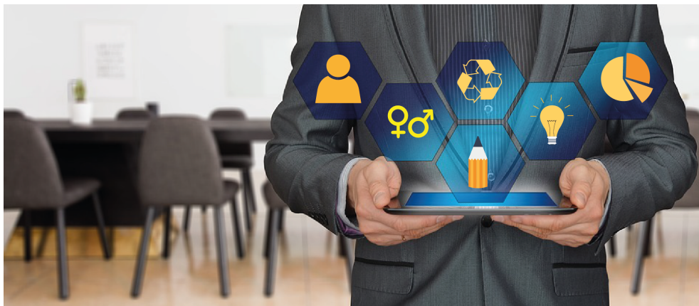
Imagen 1. Las presentaciones se pueden apoyar con imágenes y gráficos.

Las presentaciones electrónicas se caracterizan por ser herramientas de uso didáctico, las cuales se apoyan en imágenes y texto; de esta manera se pueden elaborar diapositivas digitales que contengan recursos multimedia como gráficos, videos, audios y animaciones.