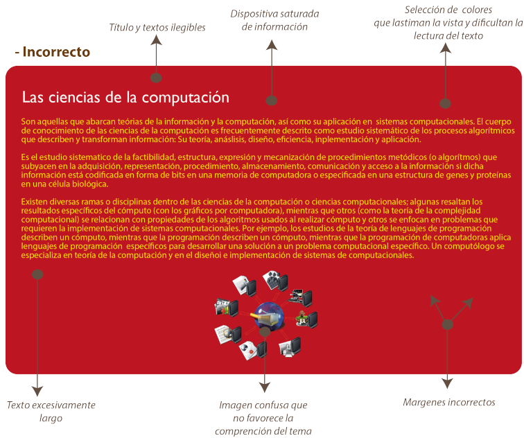
Diagrama 2. Representa la forma incorrecta de una presentación.

Microsoft PowerPoint es el programa más utilizado que permite hacer presentaciones mediante el uso de diapositivas que contienen información en formato de texto, dibujos, gráficos o videos. http://office.microsoft.com/es-mx/downloads .