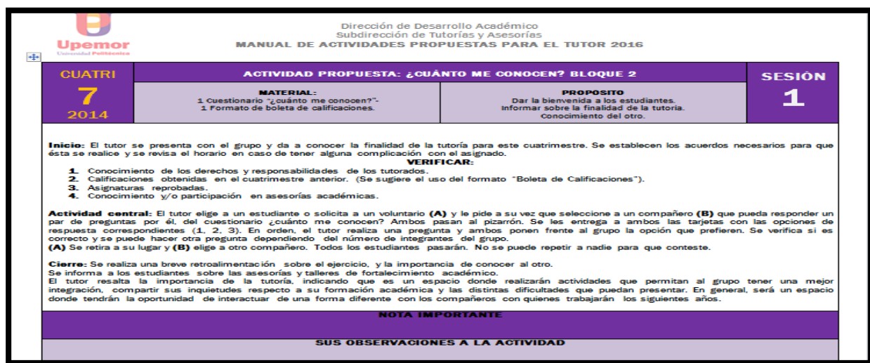
Cuadro 3. Plan actual para el trabajo de tutoría.

Esta última actualización al plan de trabajo (cuadro 3) incluye actividades que buscan continuar con el oportuno seguimiento de los tutorados en los distintos aspectos mencionados anteriormente, estableciéndose de forma tal que cualquier persona que funja como tutor pueda llevarlas a cabo sin contratiempos.